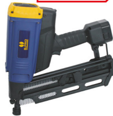
Gwoździarka typu hans

lub na adres firmy: BLACHOTRAPEZ, Sp. z o.o., ul. Kilińskiego 49a, 34-700 Rabka-Zdrój