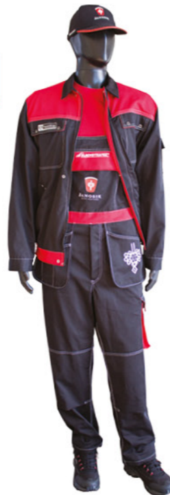
Komplet odzieży roboczej